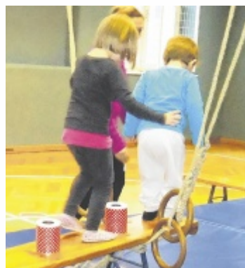
Mit Jänner starten zahlreiche neue Kurse im FBZ Eferding.

Fix zum Programm gehören die verschiedenen Erwachsenenurse wie Yoga für alle Altersgruppen sowie Kanga für Mamas mit